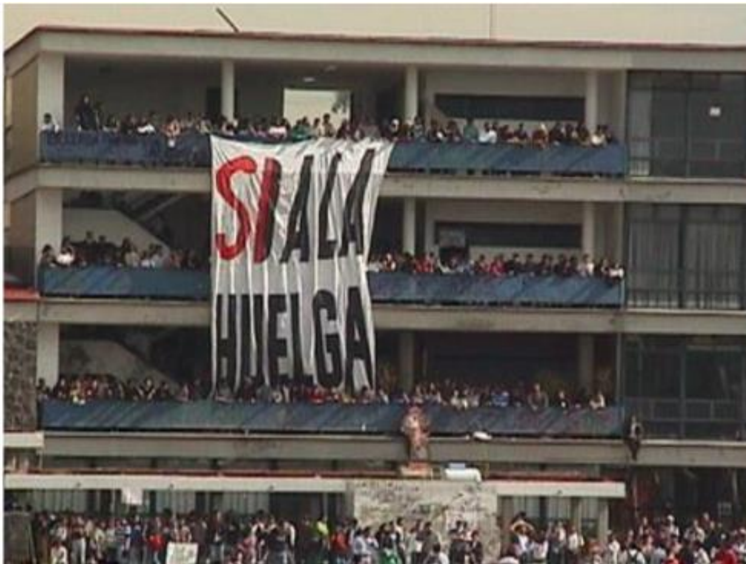
Facultad de Filosofía y Letras, CU