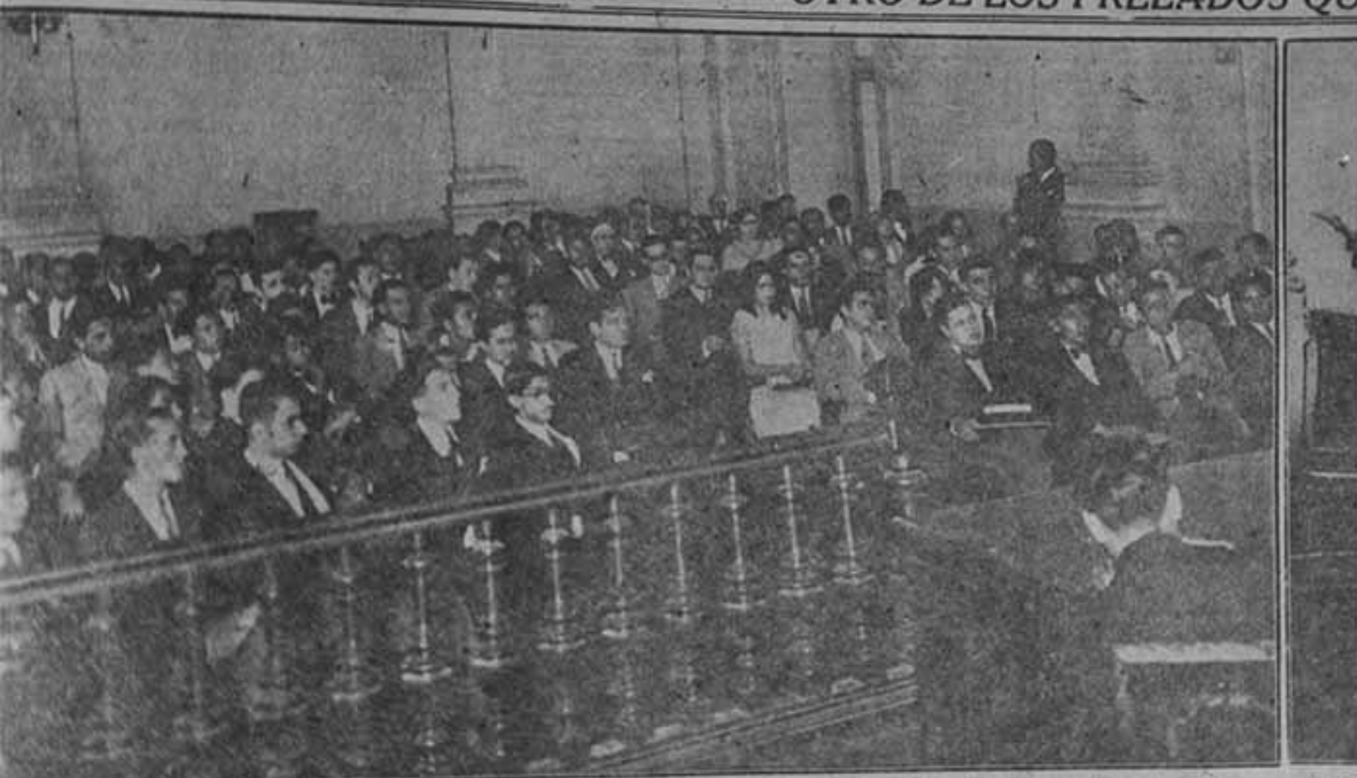
ASAMBLEA DE ESTUDIANTES.—Los alumnos de diversas facultades universitarias asistiendo a la asamblea que se efectuó ayer, en el Salón de Sesiones de la Escuela de Derecho y Ciencias Sociales, y en la que se discutió el memorial que por la vía de esta institución se presentó al señor Presidente de la República, conteniendo las peticiones de los estudiantes que en la actualidad se en-