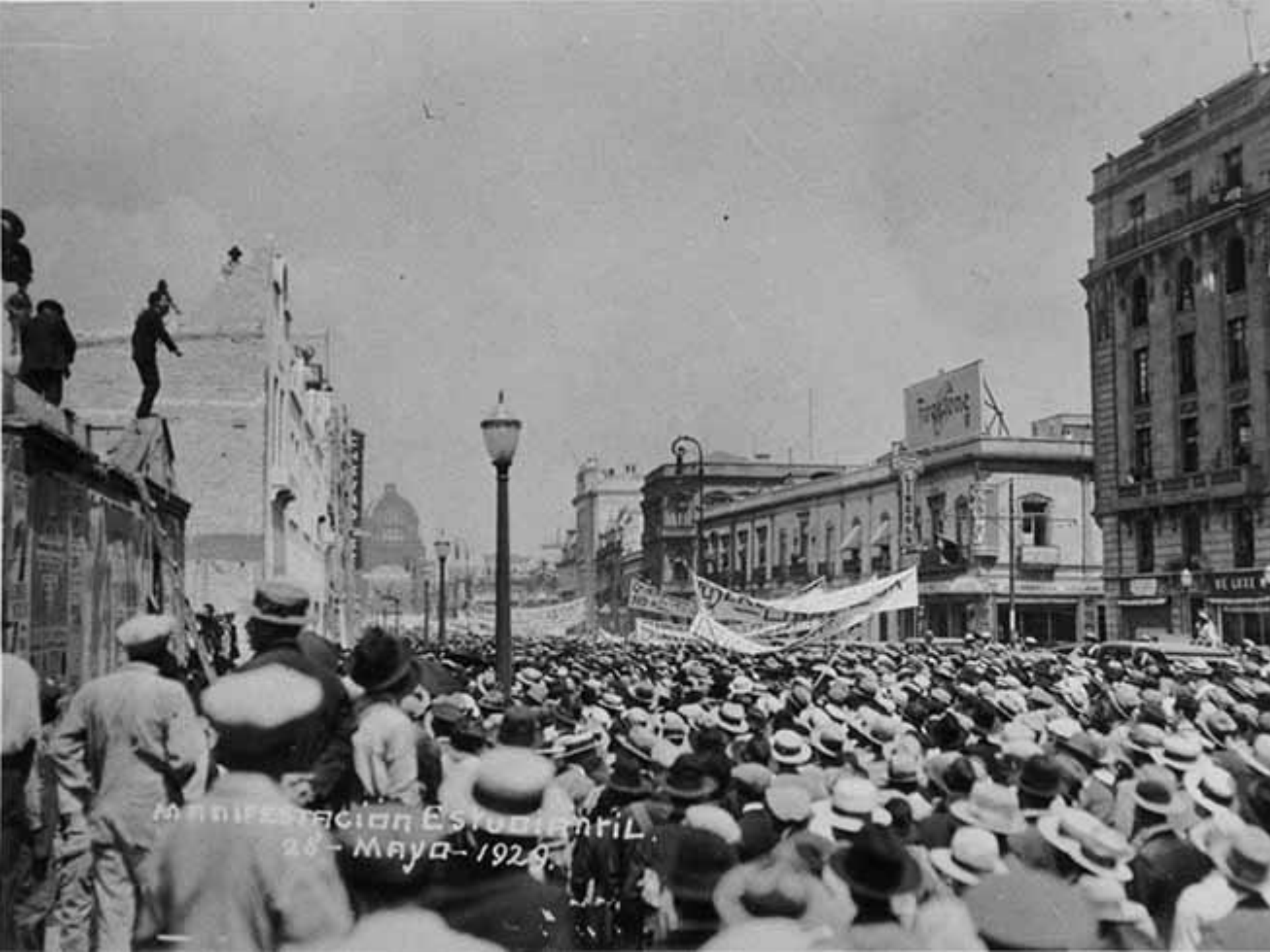
MANIFESTACION ESTUDIANTIL 25 - MAYO - 1929.